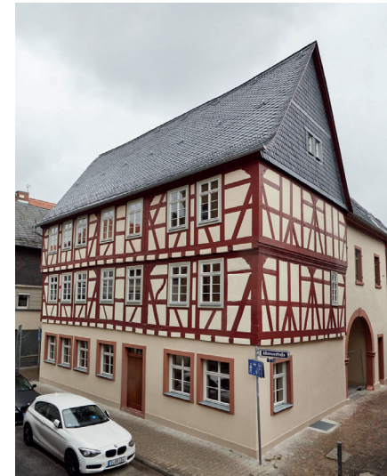
Denkmalgerecht saniert: der Goldene Adler

Nach der Sanierung strahlt der Bau in den Stadtteil, insbesondere die Fachwerkreilegung erfreut nicht nur die Höchstlerinnen und Höchstler, auch vor dem Hintergrund der Mitgliedschaft des Stadtteils Höchst in der Deutschen Fachwerkstraße kommt der Freilegung eine besondere Bedeutung zu.