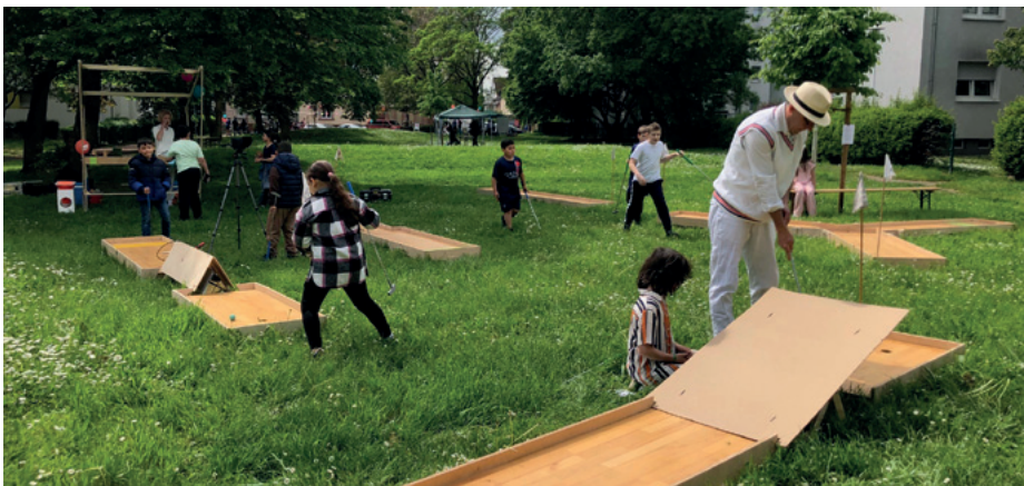
Tag der Städtebauförderung