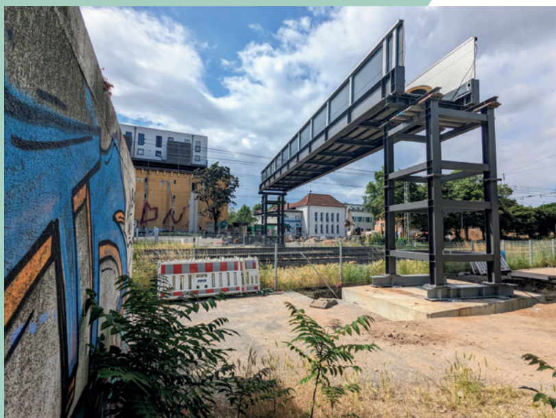
Bau der Behelfsbrücke

Infos: https://frankfurt.de/omegabruেকে-griesheim