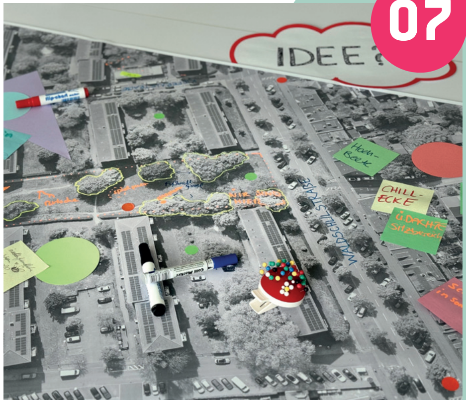
Beteiligung Kiefern-Wiesenfest