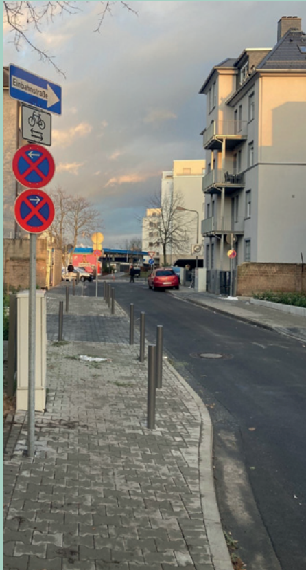
Durchstich Akazienstraße