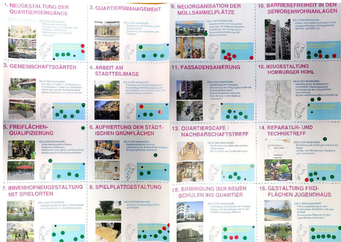
Abbildung: Ergebnisse des 3. Programmteils (rot = - ; Schwarz = +/- ; Grün = +)

Ampelmethode zu bewerten. Überwiegend ließ sich eine positive Bewertung der verschiedenen Maßnahmen verzeichnen, wobei kritische Bewertungen zu einzelnen Handlungsfelder nicht fehlten. Die Arbeit des Quartiersmanagements wurde beispielsweise durchweg positiv bewertet. Kritisch wurde vor allem das Thema „Müll“ bewertet.