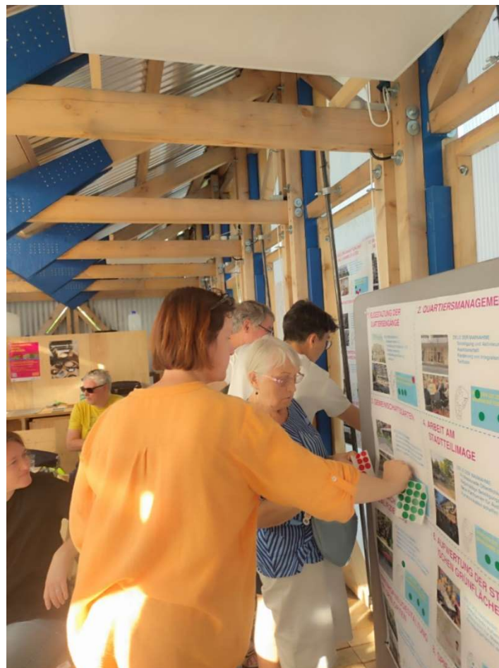
Abbildung: Bewertung der einzelnen Maßnahmen

Teilnehmer:innen: Beiratsmitglieder (Bürger:innen), Anwohner:innen, Ortsvorsteher Frankfurt-Nieder-Eschbach, Leiter des Präventionsrates, Kirche in Aktion, Vertreter Wohnungsgesellschaft GWH, Vertreterin Kifaz, Quartiersmanagement Ben-Gurion-Ring, Stadtplanungsamt Frankfurt