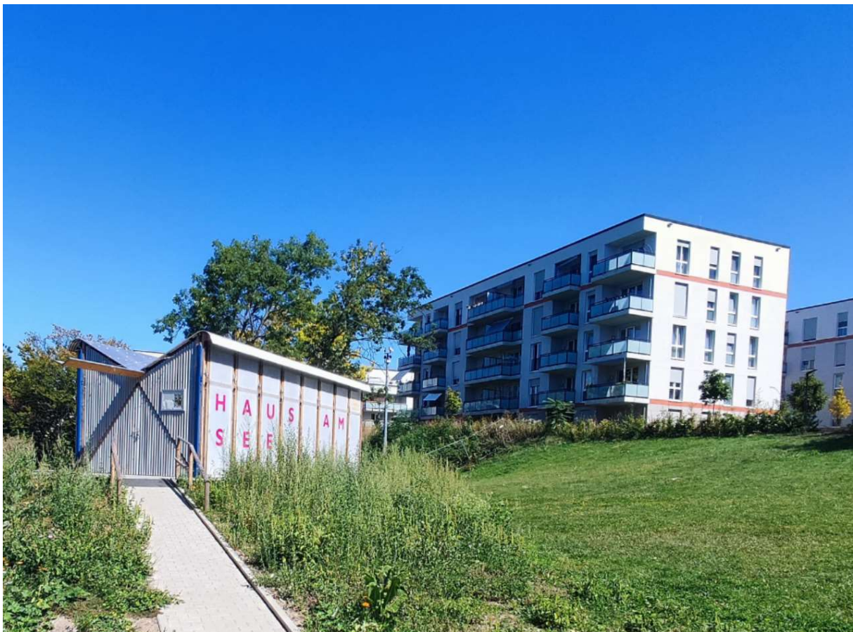
Abbildung: Interimsbau und Austragungsort des Workshops „Haus am See“

Mit einem Szenarioworkshop kann die partizipative Erarbeitung von Szenarien auch mit Laien durchgeführt werden und bietet interessierten Bürgern die Gelegenheit, Meinungen über die Weiterentwicklung einer Thematik auszutauschen, dabei eigene und fremde Erfahrungen einzubringen, Vorschläge und Bedenken zu äußern sowie in angenehm gestalteter Atmosphäre ohne Fachreferate oder Vorträge alternative Zukunftsbilder zu entwickeln.