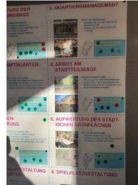
Abbildungen: Teilnehmer:innen bewerten die einzelnen Maßnahmen des ISEK