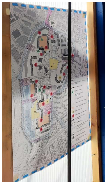
Abbildung: Einer von insgesamt drei ausgehängten Übersichtsplänen

. Zur Veranschaulichung der diversen Maßnahmen, die umgesetzt wurden im Projektgebiet, hat das Stadtplanungsamt drei Übersichtspläne im DIN A0-Format zur Verfügung gestellt.