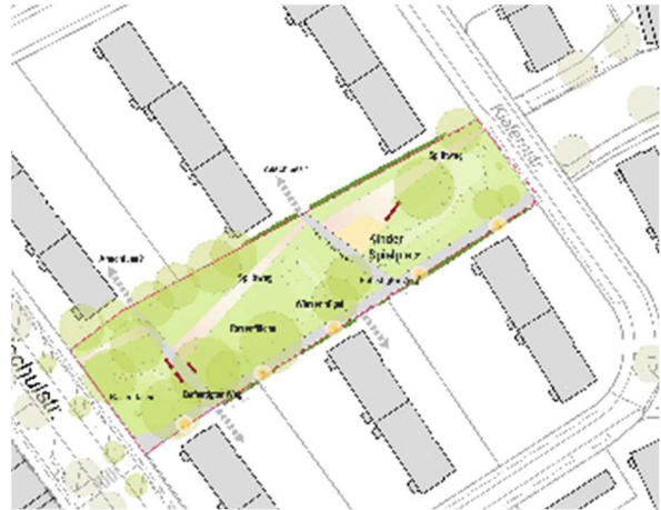
Abb. 01-02: Variante Aktivität und Begegnung (ST-FREIRAUM)