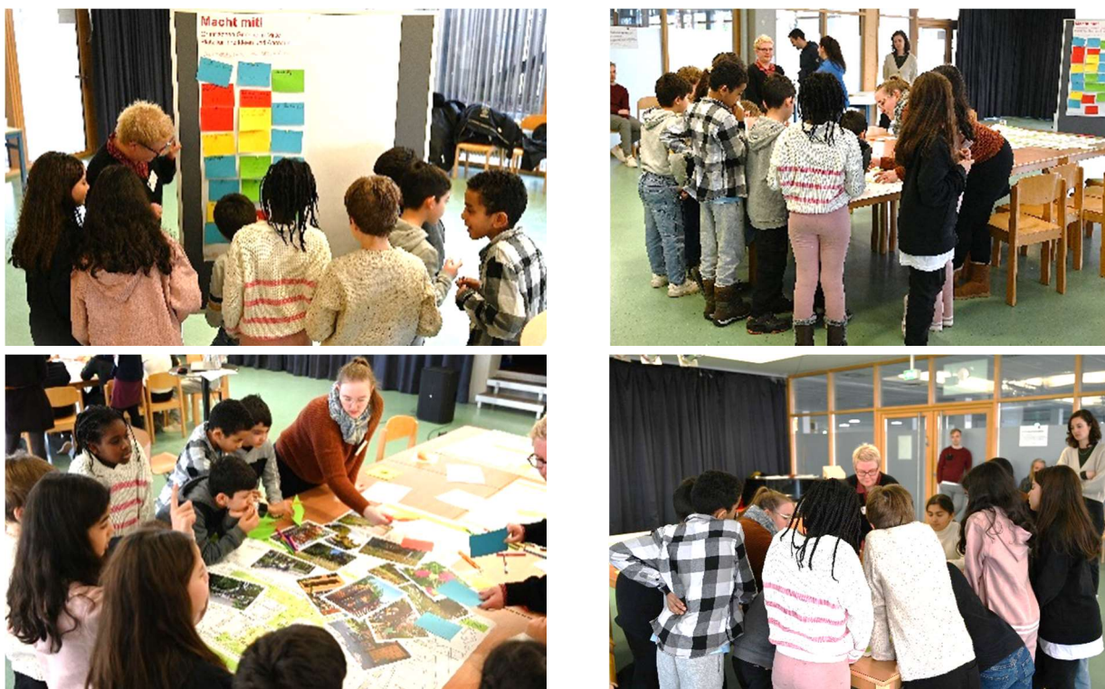
Abb. 05-08: Diskussion mit Kindern der 3. und 4. Klasse (ST-FREIRAUM)

werden. Zudem soll es gesonderte Raucherzonen geben. Ein Wunsch der Kinder ist es, dass der Radverkehr von den Fußgängern getrennt wird, um Konflikte zu vermeiden.