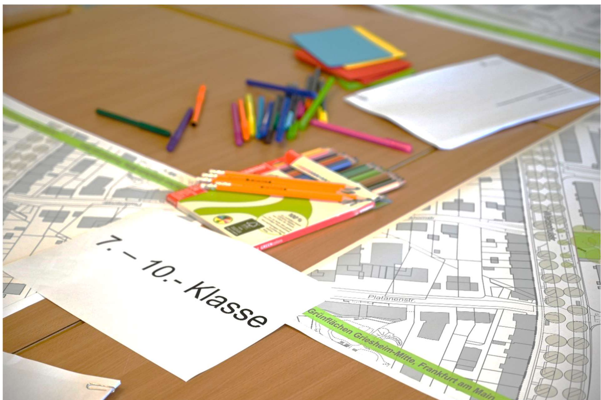
Abb. Beteiligungstisch Aula Georg-August-Zinn-Schule (ST-FREIRAUM)