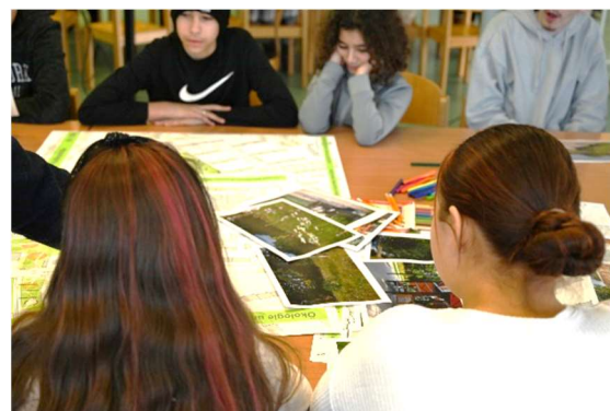
Abb. 09-12: Diskussion mit Jugendlichen (ST-FREIRAUM)

Folgende Anmerkungen und Ideen wurden von den Jugendlichen notiert: