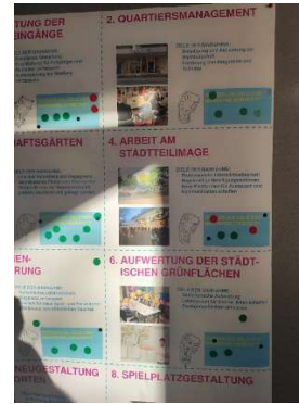
Abbildungen: Teilnehmer:innen bewerten die einzelnen Maßnahmen des ISEK