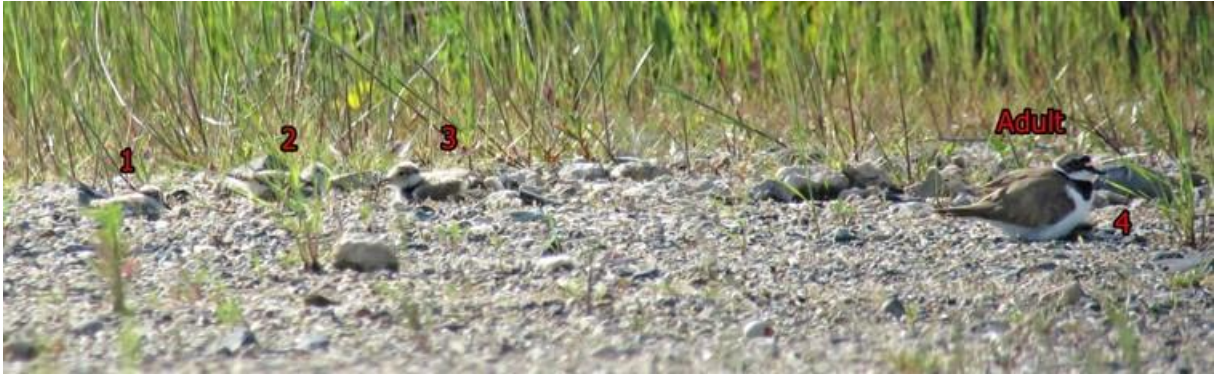
Abb. 3: Drei nicht flügge Jungvögel (links) und ein adulter Flussregenpfeifer, der einen vierten Jungvogel hudert (rechts) auf der Industriebrache in Rödelheim.