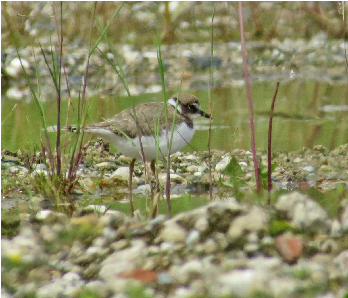
Abb. 4: Flügler Jungvogel auf der Industriebrache in Rödelheim.