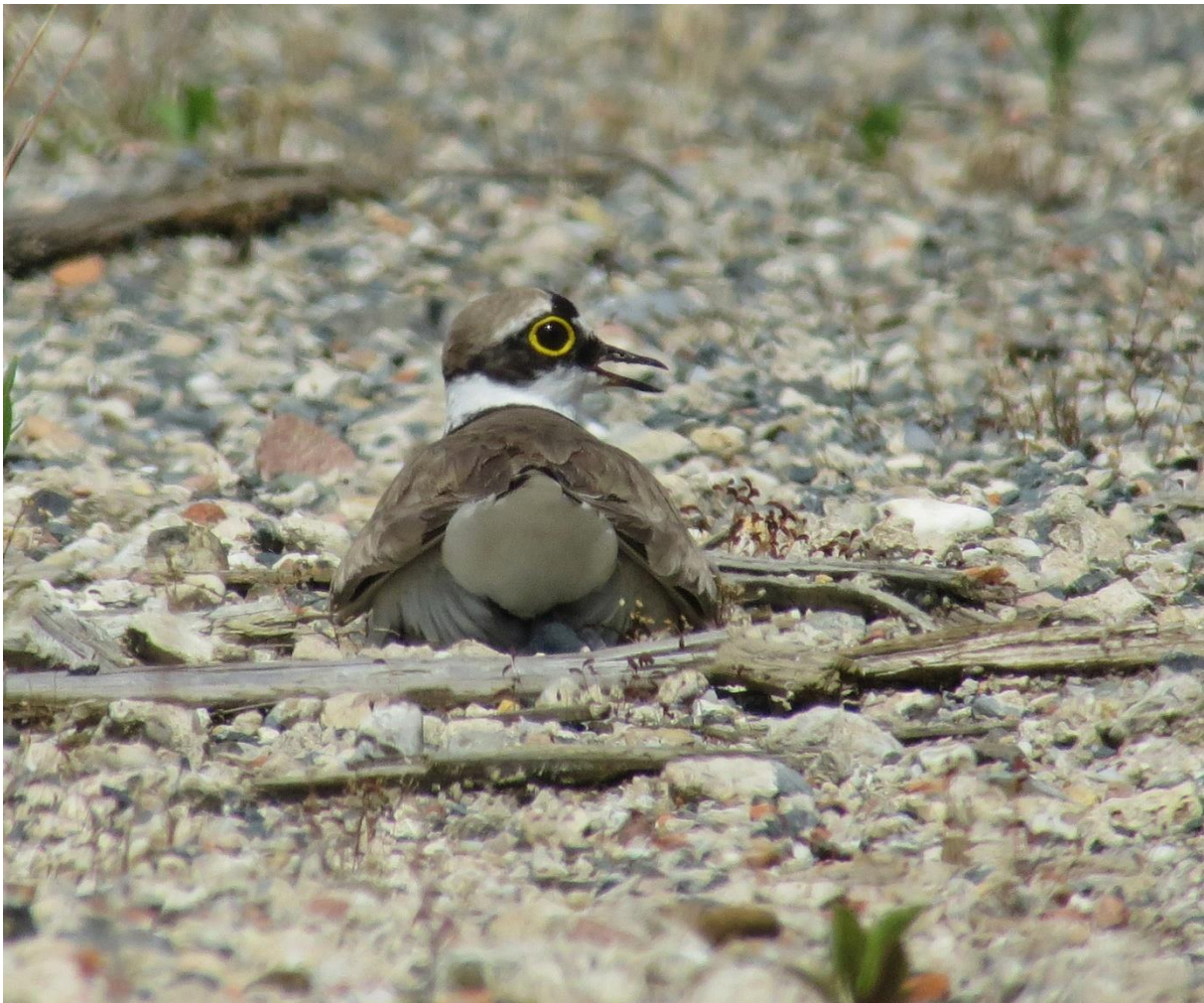
Abb. 2: Brütender Flussregenpfeifer auf der Industriebrache in Rödelheim.

Auf der Fläche in Rödelheim waren über die gesamte Brutzeit hinweg drei Paare anwesend, wobei es insgesamt zu vier erfolgreichen Bruten kam (Abb. 2 - 4). Dabei wurden 12 Jungvögel flügge.