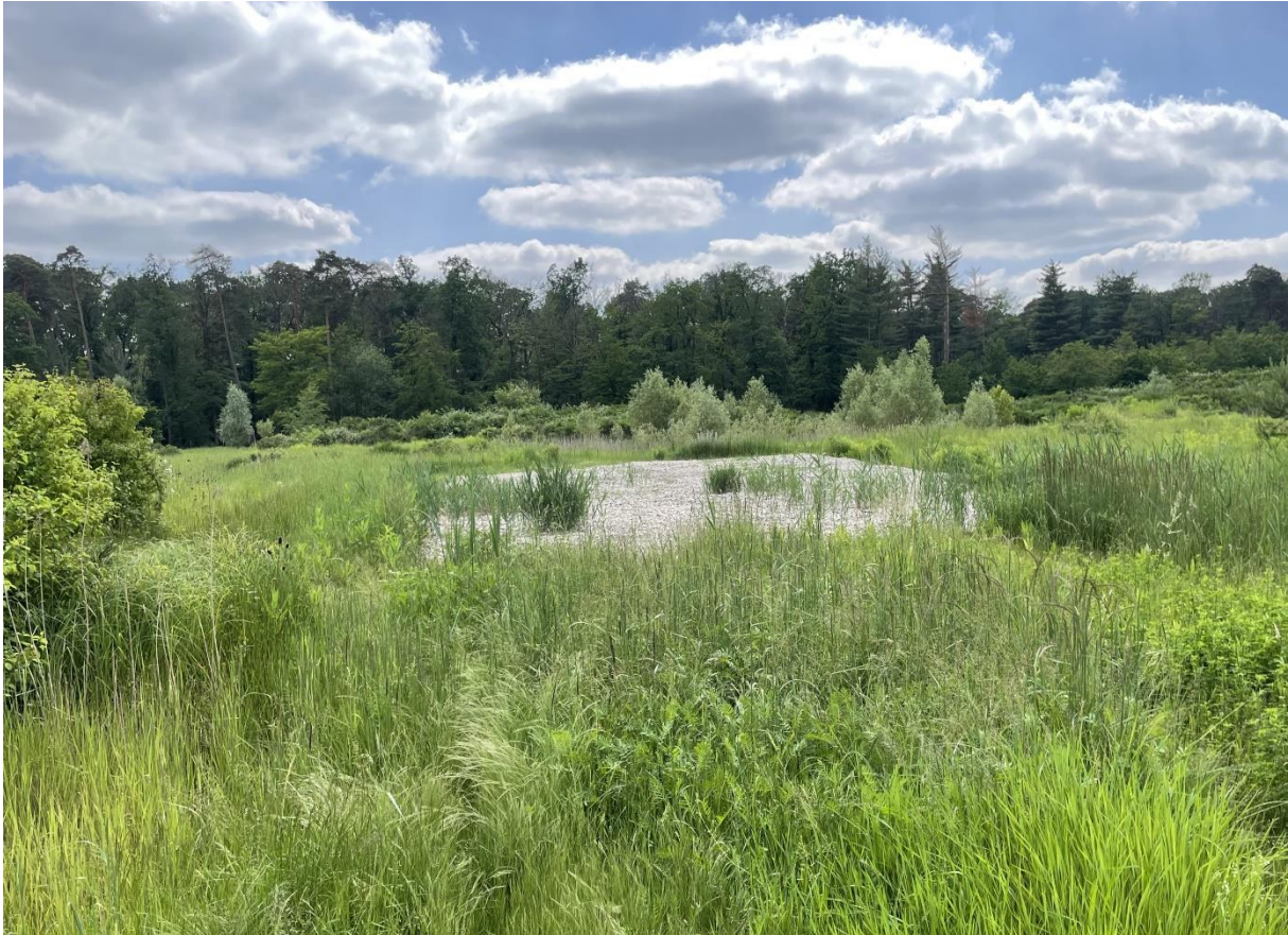
Abb. 6: Eine der Kiesflächen am Monte Scherbelino.

Sukzession mit einigen höheren Gebüschern erkennbar. Auch auf den speziell für den Flussregenpfeifer abgeschobenen Kiesflächen ist bereits im Lauf des Frühjahrs teils hoher Aufwuchs durch Gräser vorhanden (Abb. 6). Die Kiesflächen bieten zudem keinen direkten Zugang zu den vorhandenen Wasserlachen. Es ist davon auszugehen, dass ohne intensive Eingriffe (Entbuschung, großflächiges mechanisches Abschieben der Vegetation vor der Brutzeit) das Gebiet in Zukunft keinen geeigneten Lebensraum für die Art mehr darstellt.