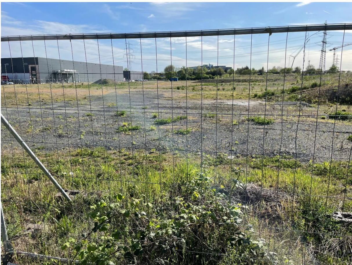
Abb. 5: Industriebrache Rödelheim.

Die Ergebnisse des Flussregenpfeifer-Monitorings im Jahr 2024 zeigen eine Konzentration der Bruten in Frankfurt auf eine einzelne Brachfläche im Industriegebiet Rödelheim. Hier waren drei Paare dauerhaft vor Ort und es kam zu vier erfolgreichen Bruten mit insgesamt 12 Jungvögeln, die flügge wurden. Dies entspricht angesichts zahlreicher Fressfeinde im urbanen Umfeld einem guten Bruterfolg. Gründe hierfür können die günstigen Bedingungen vor Ort zu liefern: die gesamte Brachfläche ist eingezäunt und somit vor Störungen weitgehend geschützt, Bauarbeiten fanden zur Brutzeit nicht statt (Abb. 5). Die Fläche war zu Beginn des Jahres noch relativ vegetationsfrei und die darauf befindlichen Wasserlachen waren auf Grund einer nassen ersten Jahreshälfte bis weit in den Sommer hinein noch nicht ausgetrocknet.