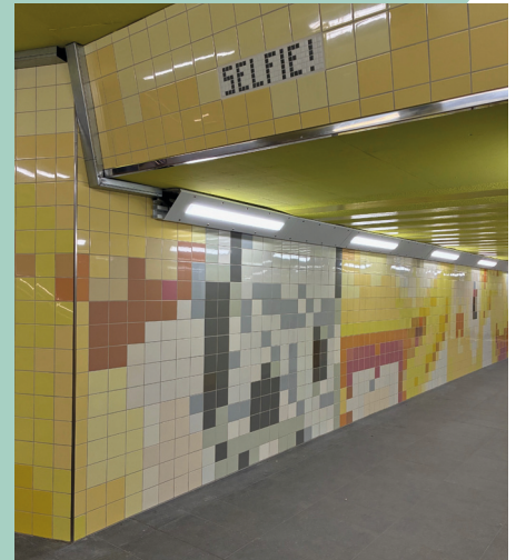
Personenunterführung @ BSMF mbH

Im Rahmen eines stadtweiten Konzepts wurden die zentralen Straßen vor der Berthold-Otto und Georg-August-Zinn Schule als sogenannte Schulstraßen ausgewählt. Dabei wird sowohl ein Abschnitt der Kiefernstr. als auch „Am Mühlgewann“ vor Schulbeginn für den Autoverkehr gesperrt, um den Schüler:innen ungehindert von Eltern-taxis einen sichereren Schulweg zu ermöglichen.