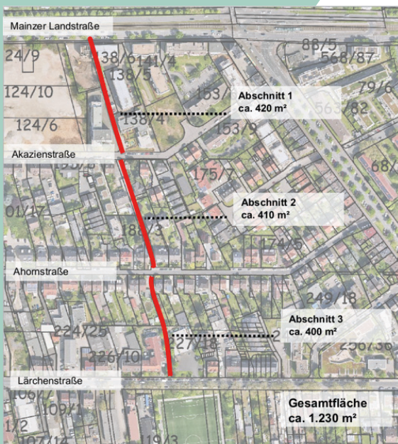
Abbildung Mainzer Landstraße - Lärchenstraße © BSMF mbH; Kartengrundlage: Stadtvermessungsamt Frankfurt am Main