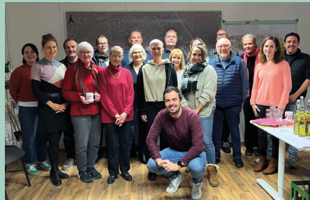
Gruppenbild LoPa mit Stadtplanungsamt, BSMF und Internationaler Bund

Über die Sitzungen hinaus, haben sich die Mitglieder:innen intensiv bei den Beteiligungsformaten zur Entwicklung des Quartiersplatzes oder zur geplanten Gestaltung der Grünflächen Schwarzerlenweg/Kiefernstraße eingebracht. Auch zahlreiche Veranstaltungen, wie die Einweihungen der Spiel- und Sport-