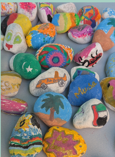
Kleine kunterbunte Kiesel

Auf Anregung der LoPa wurden im Rahmen einer partizipativen Aktion die Findlinge im Sandkasten am Spielplatz Schwarzerlenweg farbenfroh gestaltet und sichtbar gemacht. Zusätzlich konnten Kinder aus der Nachbarschaft ihre Malkünste an kleinen Kieselsteinen beweisen. Mittlerweile sind die zuvor beweglichen Steine fest einbetoniert.