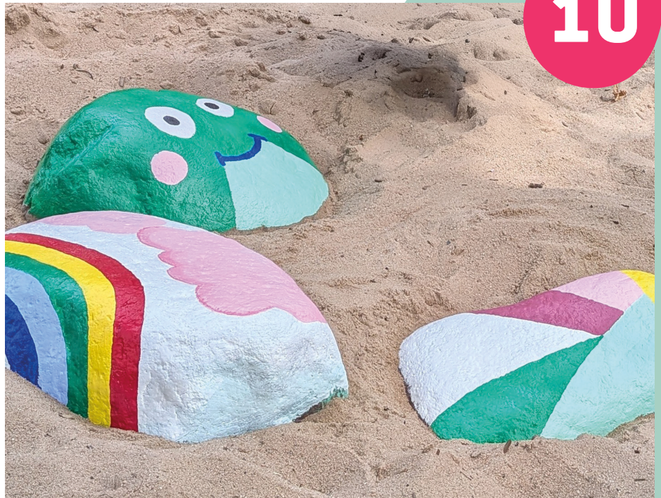
Kunterbunte Kiesel