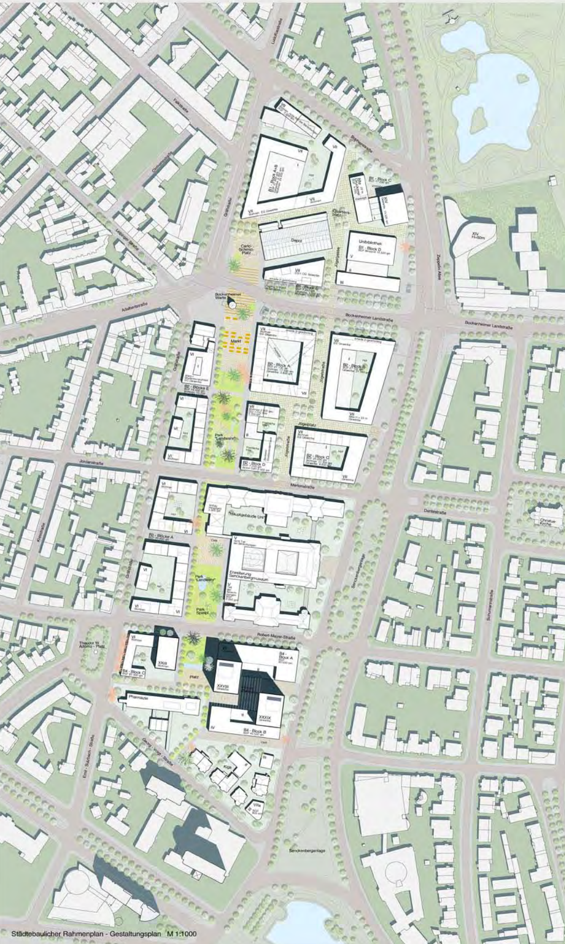
Städtebaulicher Rahmenplan - Gestaltungsplan M 1:1000

Städtebaulicher Rahmenplan - Kerngebiet Bockenheim