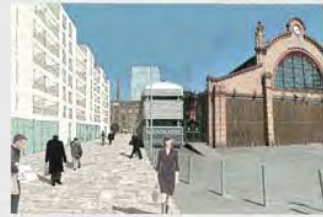
Dankschöche Druckerei im Dippel